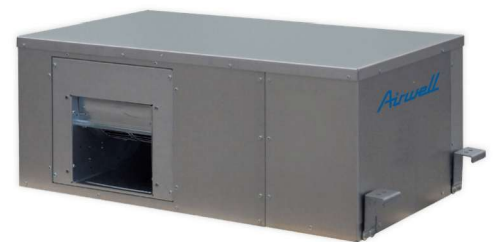
DFMO Pompe à chaleur sur boucle d'eau